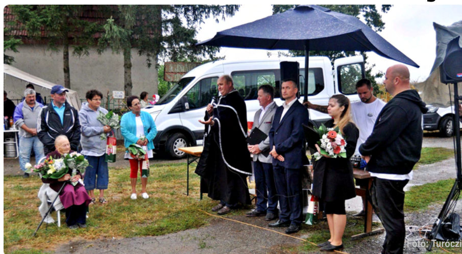
Az üdvözlés, köszöntés és az ima percei