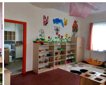
Ficánka csoport szobája