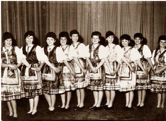
A Nagylétai Gimnázium táncsoportja 1965 – 1966-ban