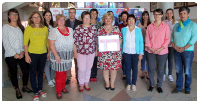
Alsó tagozatos kollégáink az oklevéllel

A 2017/2018-as tanévben iskolánk Bagdi Bellától vehette át a Boldog Iskola címet, melyet ebben a tanévben Budapesten az Erkel Színházban ismét átvehettünk.