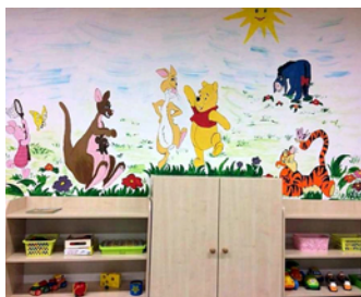
Gomba csoport szobája

A bölcsődei két tágas csoportszoba esztétikus, életkorak megfelelő új bútorokkal, játékokkal gazdagon ellátott.